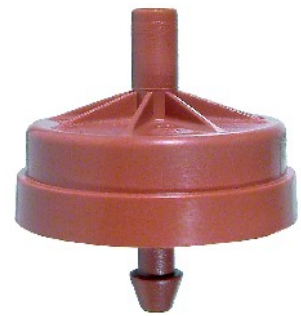
PC CNL hengeres kimenőcsatlakozás